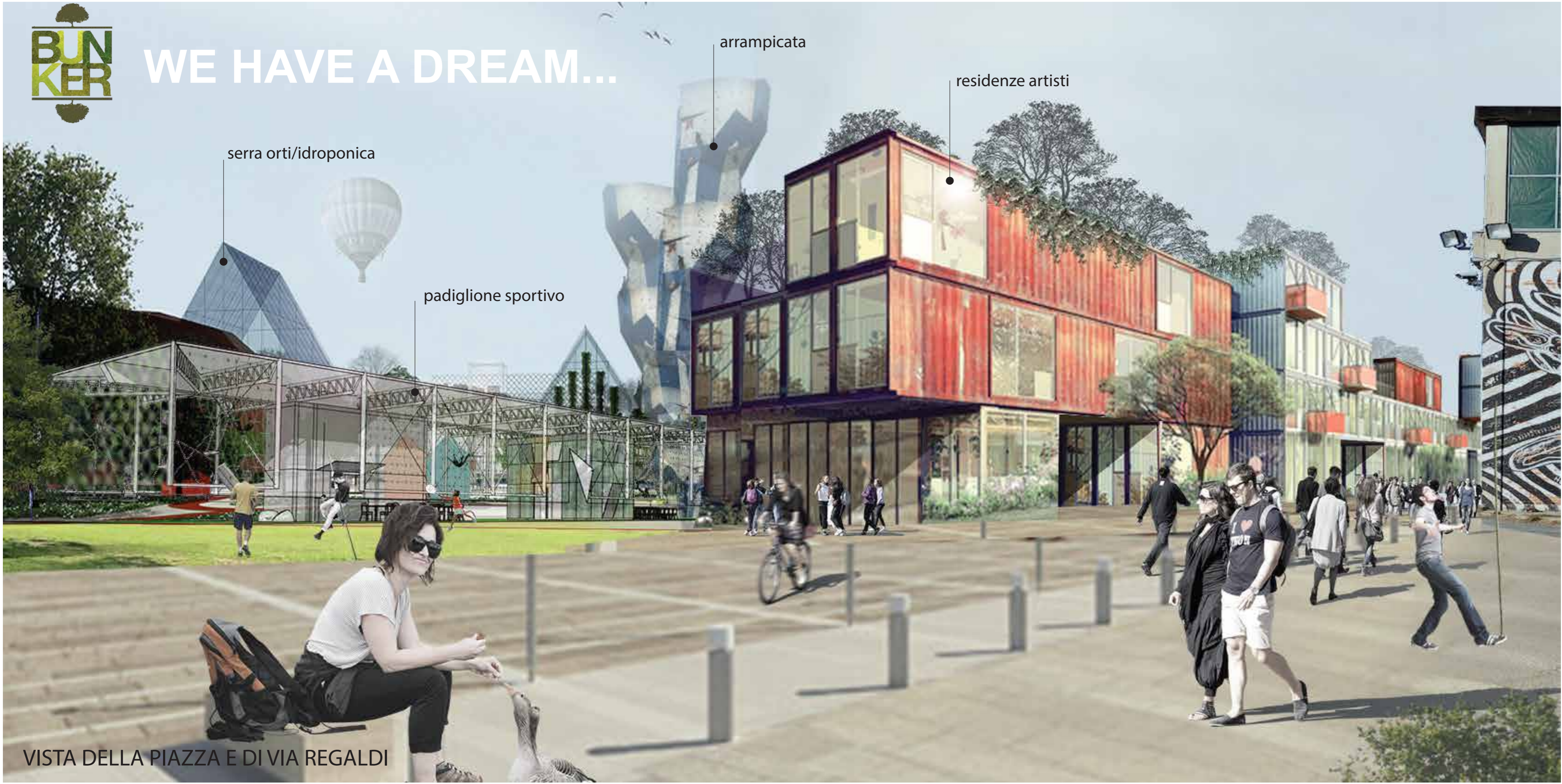
VISTA DELLA PIAZZA E DI VIA REGALDI